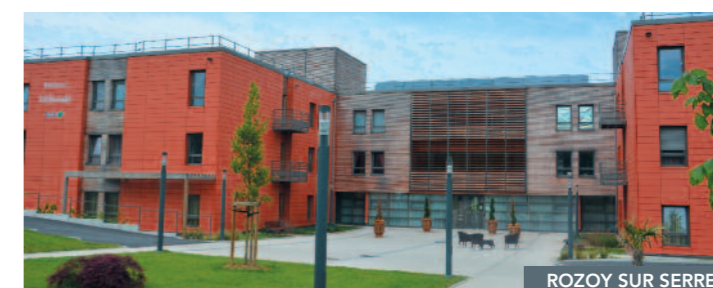
ROZOY SUR SERRE