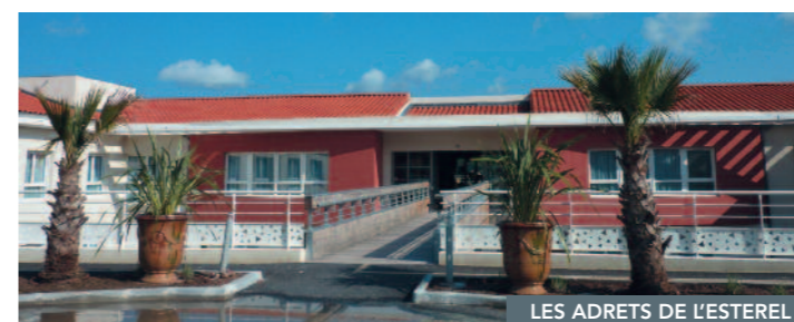
LES ADRETS DE L'ESTEREL