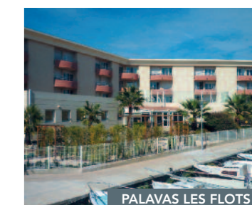
PALAVAS LES FLOTS