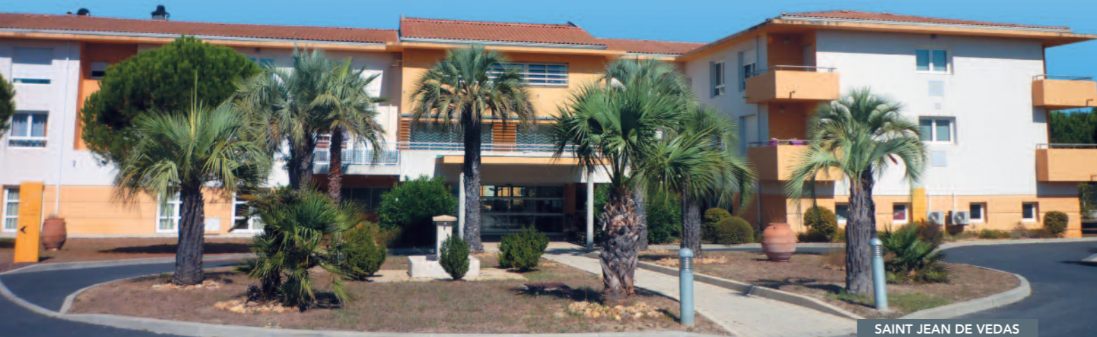
SAINT JEAN DE VEDAS

Groupe MBV - UNION Branche Parcours Résidentiel : 04 99 52 22 99